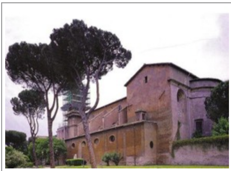
Bildmotiv: Benediktinerkloster St. Bonifatius und Alexius auf dem Aventin in Rom (©, p. 36)

Auf einer hohen Stufe eines heiligmäßigen Lebens nimmt er am mönchischen Alltag teil. Er protestiert heftig, als die Mönche ihn weiterhin als Bischof in amtlicher Funktion einsetzen wollen, etwa bei der Weihe von Kirchen. Er widmet sich bewusst auf dem Aventin dem schlichten Leben eines Mönchs. Er verrichtet niedrige Dienste und verbringt viel Zeit in Gebet, Meditation und Kontemplation.