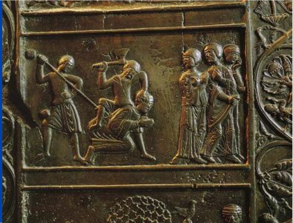
Martyrertod Adalberts, Bronzetür am Dom von Gnesen