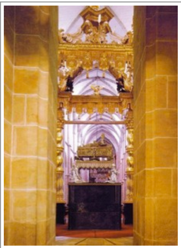
Bildmotiv: Das Grabmal in der Gnesener Marienkirche heute

Er wird - es ist der 23. April 997 - auf den Gerichtshügel geführt, wo der heidnische Priester ihn mit einem Speer durchbohrt. Der Legende zufolge fleht Adalbert sterbend um sein und seiner Mörder Seelenheil. Die Mörder lassen ihre Wut am toten Adalbert aus. Sie schlagen seinen Kopf ab und heften diesen auf einen Pfahl. Als Ort des Martyrergeschehens nennt die Tradition verschiedene Orte. Die größte Wahrscheinlichkeit hat Heiligenwalde bei Elbing, im Land zwischen Nogat und Weichsel, für sich. Nachdem die Nachricht vom Martertod den polnischen Herzog erreicht hat und dieser das Haupt Adalberts erhalten hat, löst Boleslaw den zurückgebliebenen Leichnam gegen ein Lösegeld von den Prußen aus und lässt ihn in der Gnesener Marienkirche bestatten.