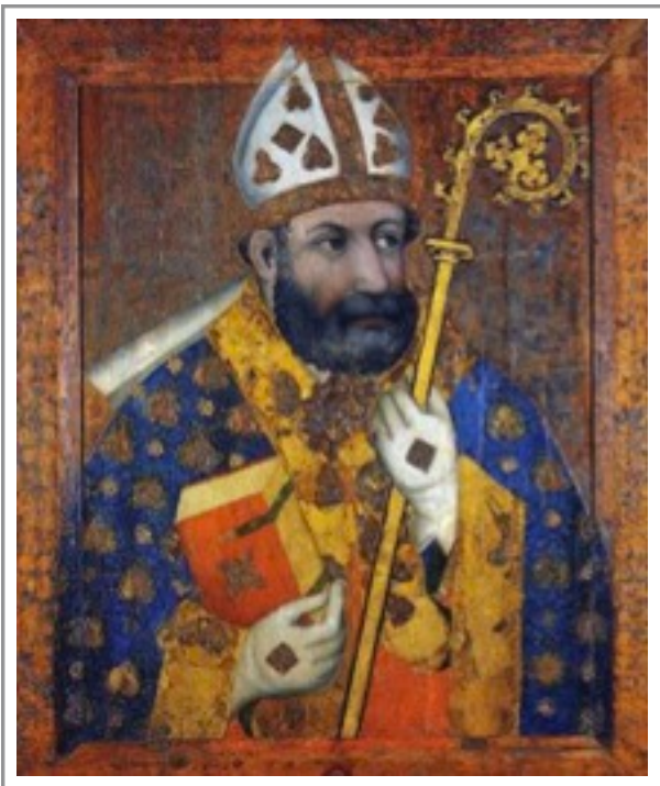
Bildmotiv: Darstellung Adalberts von Karlstein bei Prag

Auch in politischer Hinsicht steht Adalbert eher für das Universale als für das Partikulare. Man könnte Adalbert einen „politischen“ Heiligen nennen, insofern er zeit seines Lebens in den Sog der Politik geriet. Auch erlitt er in seiner Verehrungsgeschichte so etwas wie eine politische „Instrumentalisierung“. Augenfällig mag dies in jener bildlichen Darstellung werden, die Karl IV. als Tafelbild aus der Werkstatt des Meisters Theoderich in der Heiligkreuzkapelle auf der imposanten Anlage von Karlstein im Herzen Böhmens anfertigen ließ. 15