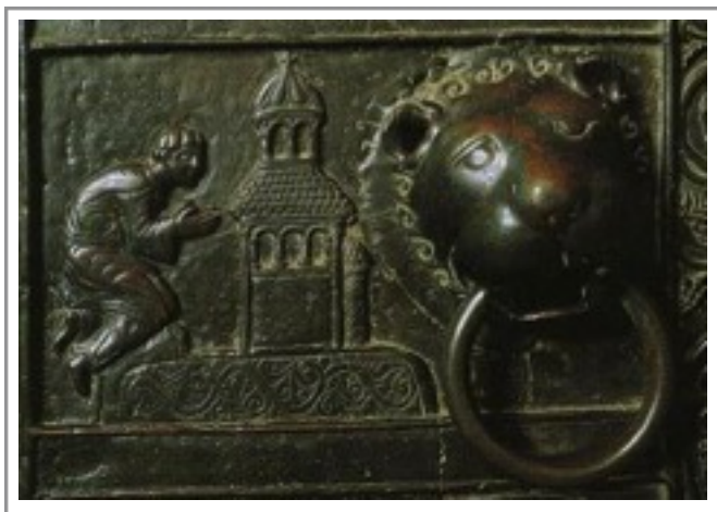
Bildmotiv: Der betende Adalbert (©, p. 23)

Auf einer hohen Stufe eines heiligmäßigen Lebens nimmt er am mönchischen Alltag teil. Er protestiert heftig, als die Mönche ihn weiterhin als Bischof in amtlicher Funktion einsetzen wollen, etwa bei der Weihe von Kirchen. Er widmet sich bewusst auf dem Aventin dem schlichten Leben eines Mönchs. Er verrichtet niedrige Dienste und verbringt viel Zeit in Gebet, Meditation und Kontemplation.