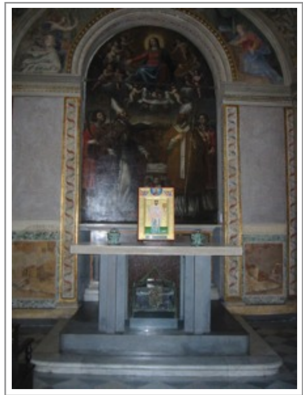
Bildmotiv: Adalbert-Reliquien unter dem Altar von S. Bartolomeo

In diesem Reliquiar befinden sich Reliquien, die Otto III. vom polnischen Fürsten Boleslaw Chrobry bei seinem Besuch in Gnesen im Jahr 1000 erhalten hatte. Rom ist also ein zentraler Ort der Verehrung Adalberts, wie Rom ja auch für das Leben Adalberts bedeutend