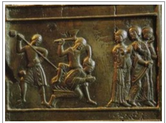
Bildmotiv: Adalberts Martyrertod

dennoch reich an Ereignissen und Begegnungen - so mit Papst Gregor V. und dem jungen Kaiser Otto III. Der Mainzer Erzbischof Willigis zählt ebenfalls dazu; er drängt auf die erneute Rückkehr Adalberts nach Prag. Unter der Voraussetzung, dass seine Rückkehr nach Prag nicht mehr möglich ist, erwirkt Adalbert von Gregor V. die Erlaubnis, bei den Heiden das Evangelium zu verkünden. Nach päpstlicher Zustimmung begibt er sich auf die Missionsreise. Sie führt ihn zunächst über Frankreich nach Deutschland. In Mainz trifft er erneut mit Otto III. zusammen. Schließlich gelangt er nach Polen. Dort vertraut ihm der polnische Herzog Boleslaw Chrobry in Gnesen die Mission bei den Prußen an. Gemeinsam mit seinem Bruder Radim, der den Ordensnamen Gaudentius angenommen hatte, und begleitet durch einen Diener setzt Adalbert auf die Wirkung des verkündigten Evangeliums, als er nach kurzer Seefahrt von Danzig aus auf die Prußen trifft. Es ist eine konflikthafte Zusammenkunft, bei der die Missionare barsch zum Verlassen des Landes aufgefordert werden. Trotz des Rückzugs wird Adalbert mit seinen Gefährten am nächsten Tag von den Prußen überfallen und überwältigt.