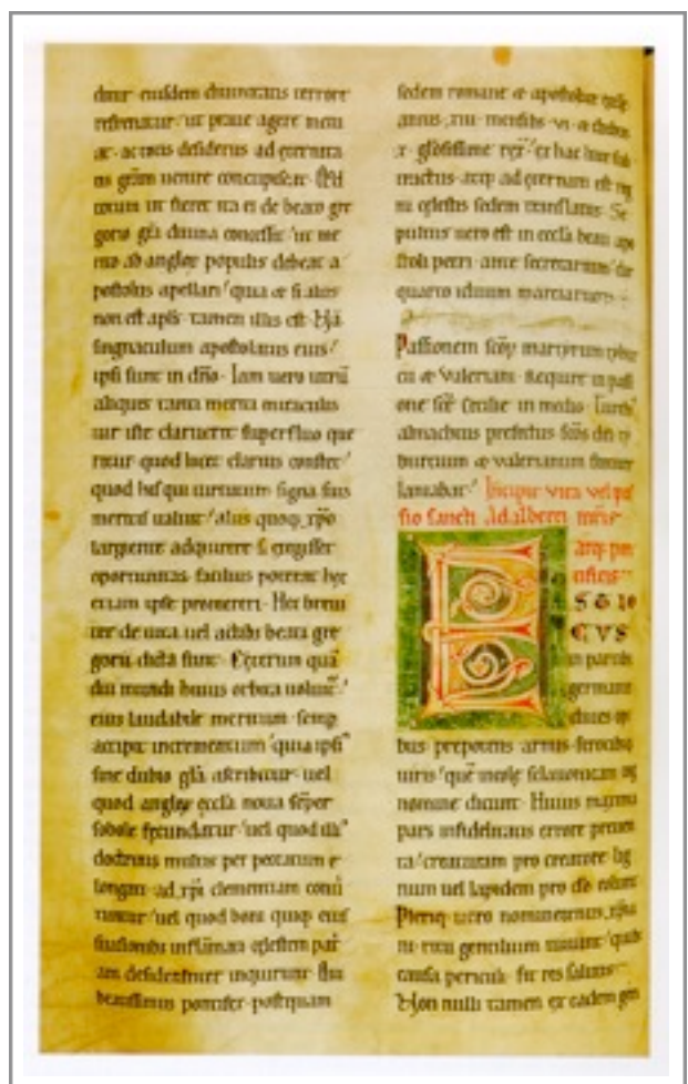
Bildmotiv: Das wiederentdeckte Aachen-Manuskript zur Adalbert-Vita: Initiale E in einer Handschrift der Vita des hl. Adalbert, um 1200 (© Mario Kramp, Hg., Krönungen. Könige in Aachen – Geschichte und Mythos. Katalog der Ausstellung in zwei Bänden, Mainz 2000, S. 299)

Die Adalbert-Stiftung knüpft mit Gespür für geschichtliche Zusammenhänge bei ihrer politischen Arbeit an der Memoria des Hl. Adalbert an. Im Rahmen der vom Millennium angeregten Forschungen gab es in Aachen eine bemerkenswerte Entdeckung. Aachen ist ein alter Ort der Adalbert-Verehrung. Aber es war doch eine Ü-