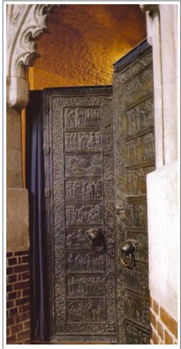
Bildmotiv: Die Gnesener Tür der Marienkathedrale mit Stationen des Lebens Adalberts von Prag (©, p. 81)

zu Adalbert als europäischen Heiligen gepflegt werden, welches das Ganze der Biographie und der Wirkung Adalberts in den Blick nimmt.