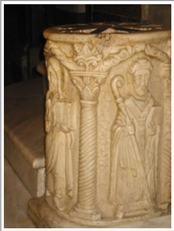
Bildmotiv: Älteste Darstellung Adalberts auf dem Taufstein von S. Bartolomeo (©, p. 83)

Die älteste bildliche Darstellung Adalbert findet sich in der Kirche S. Bartolomeo. Es ist ein Steinrelief an der Brunneneinfassung des Taufbrunnens.