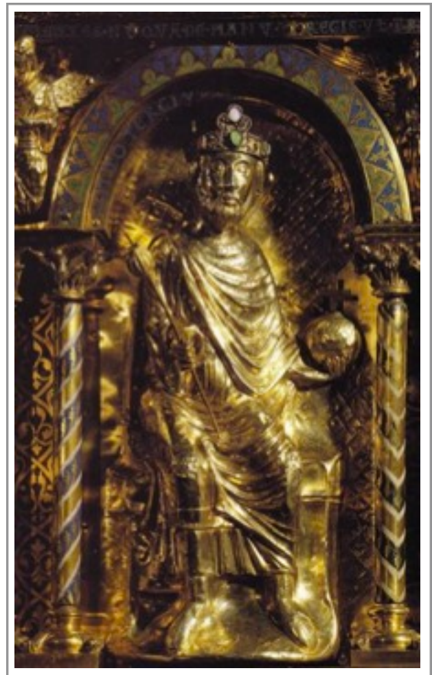
Bildmotiv: Otto II. – Freund Adalberts

Adalberts Tod findet einen ungeheuren Widerhall in der abendländischen Christenheit. Papst Silvester II., der vor seiner Papstwahl Adalbert in Rom kennen gelernt hatte, spricht ihn schon 999 heilig.